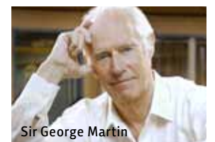
Sir George Martin