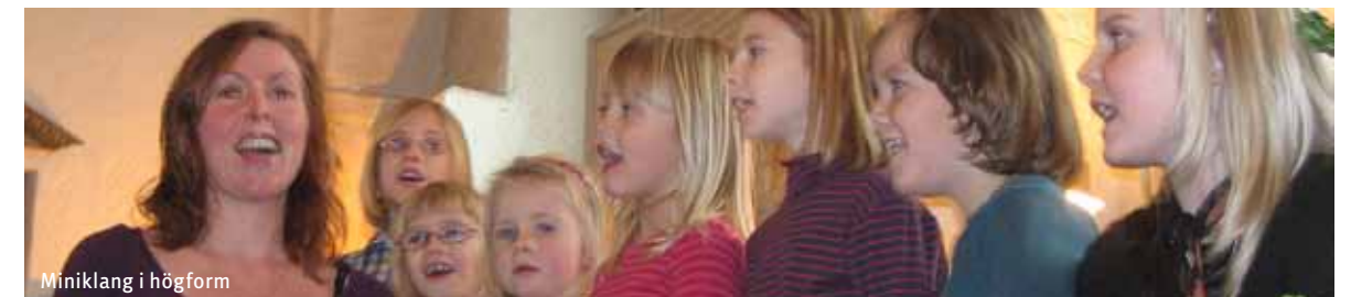
Miniklang i högform

Samspel är ett treårigt projekt, finansierat av Allmänna Arvsfonden, i samarbete med Furuboda kompetensCenter, Högskolan Kristianstad, Riksgymnasiet Kristianstad och Hjärnskadeförbundet Hjärnkraft som syftar till att öka möjligheterna för personer med omfattande rörelsehinder att aktivt delta i musikkultur. I projektet prövas bl.a. olika slag av databaserade verktyg för att utveckla möjligheten att musicera individuellt och i grupp.