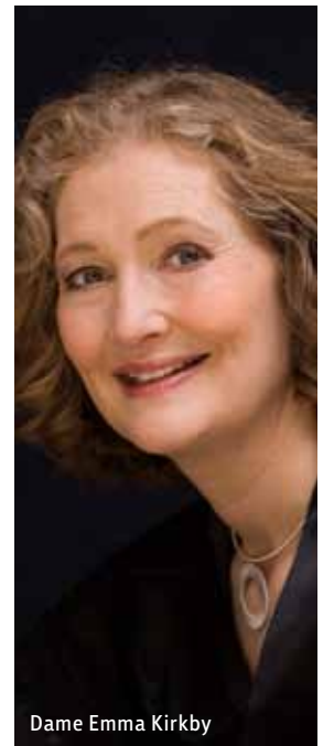
Dame Emma Kirkby