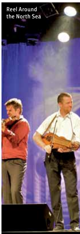
Reel Around the North Sea