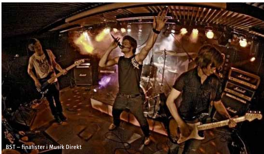
BST – finalister i Musik Direkt