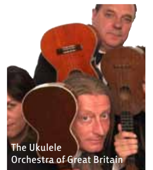
The Ukulele Orchestra of Great Britain