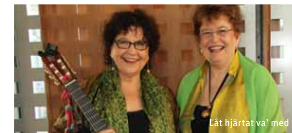
Låt hjärtat va' med