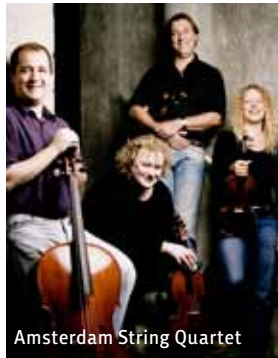
Amsterdam String Quartet