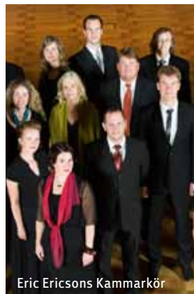
Eric Ericsons Kammarkör